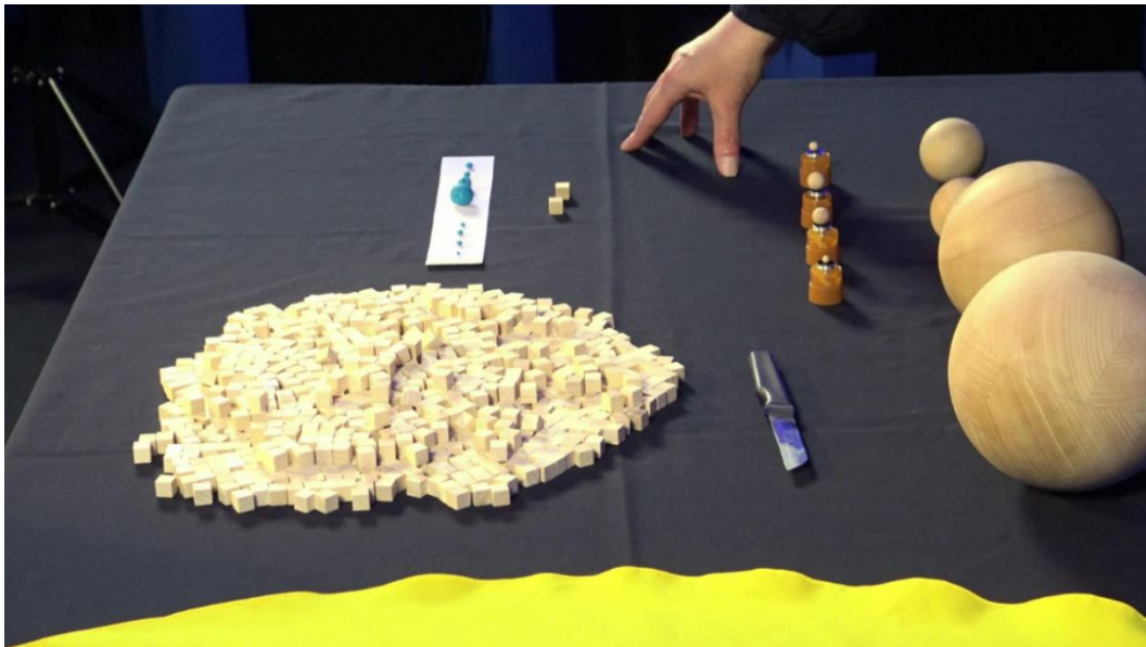
Abbildung 1: Massenverteilung im Sonnensystem; der große Haufen (998 Würfel) repräsentiert die Sonne, die übrige gebliebenen 2 Würfel wurden durch Knete ersetzt und entsprechend ihrer ungefähren Massenanteile auf die Planeten verteilt (blaue Kügelchen, s. auch Staffel 1:Folge 4)

Von den 1000 Massewürfeln (oder Kugeln etc.) entfallen 998 auf die Sonne! Nur 2 Würfel, also rund 0,2% der Masse des Sonnensystems, entfallen auf die Planeten (s. Abbildung 1).